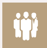
Trophées RSE Social